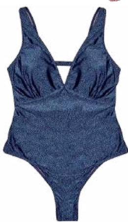
Maiô plus size Pernambucanas. R$ 99,99. @pernambucanas