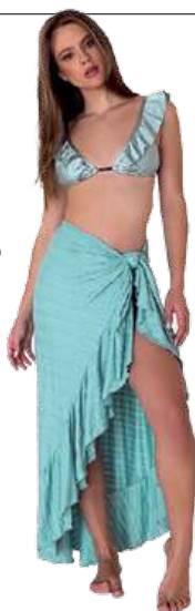
Biquíni e saia Cintee. Preço sob consulta. @cinntestore