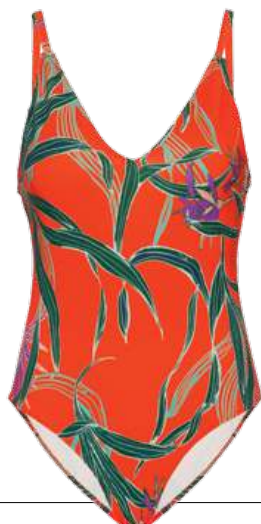
Maiô Estela Colcci. R$ 159. @colcciofficial