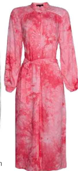
Vestido feminino mindset chemise midi estampado tie-dye manga longa, na C&A. R$ 199,99 cea.com.br