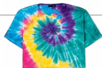
Blusa cropped tie-dye colorido, na Renner. R$ 49,90 renner.com.br