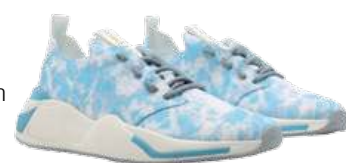
Tênis Fiever em tie-dye. R$ 398 fiever.com.br