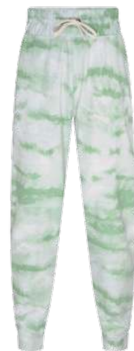
Calça de moletom feminina jogger cintura alta estampada tie-dye verde, na C&A. R$ 89,99 cea.com.br