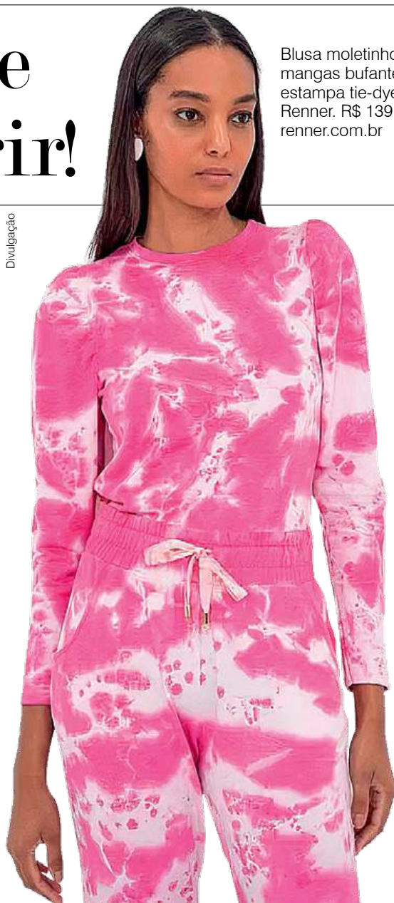
Blusa moletinho com mangas bufantes estampa tie-dye, na Renner. R$ 139,90 renner.com.br