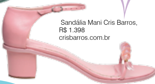
Sandália Mani Cris Barros, R$ 1.398 crisbarros.com.br

Apesar de claras e leves, estas cores podem dar origem a visuais com um toque de drama. Neste caso, elas trabalham ao lado da cartela das cores mais saturadas. Enquanto o rosa se conecta com o coral, o azul-bebê faz parceria perfeita com tons mais escuros e acinzentados da mesma família.