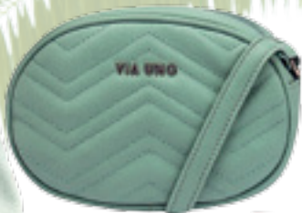
Bolsa Baby Floater Via Uno viauno.com.br

Esses verdes mais clarinhos são os campeões no gosto da maioria; criando sofisticação e possibilidades de combinações assertivas como com cores análogas (próximas da cartela como verde esmeralda, verde água e o Tiffany) e também com cores complementares criando o contraste perfeito com todos os rosas. Todas em produções divertidas e com toque de refino.