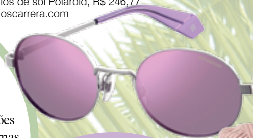
Óculos de sol Polaroid, R$ 246,77 oculoscarrera.com