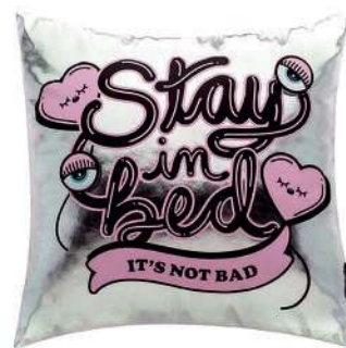
Almofada Always Sleepy, na Imaginarium. R$ 69,90 imaginarium.com.br