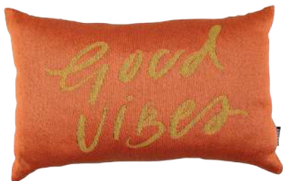
Good Vibes Jacquard, na Etna. R$ 69,99 etna.com.br