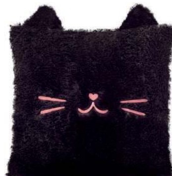
Almofada gatinho, na Imaginarium. R$ 99,90 imaginarium.com.br