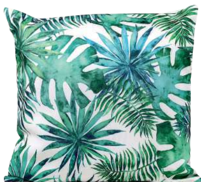
Almofada estampada, na Rica Festa. Preço sob consulta - ricafesta.com.br